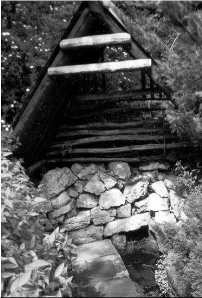
Studánka u Červeného lomu (č. 5)