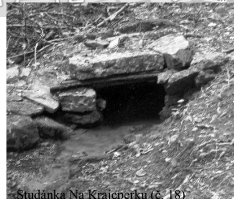
Studánka Na Krajčepku (č. 18)