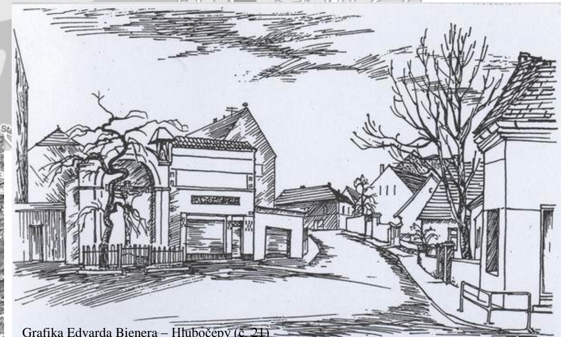
Grafika Edvarda Bienera – Hlubočepý (č. 21)