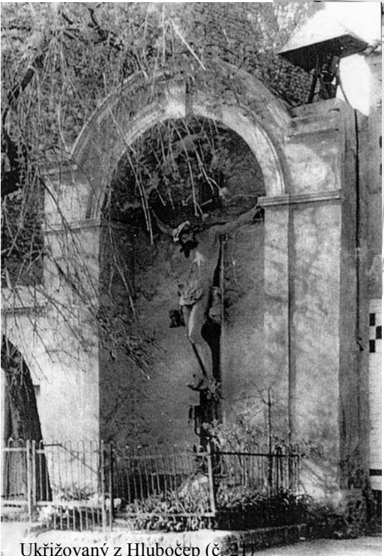
Ukřižovaný z Hlubočep (č. 21)