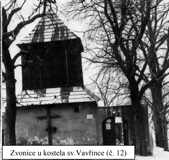
Zvonice u kostela sv. Vavřince (č. 12)