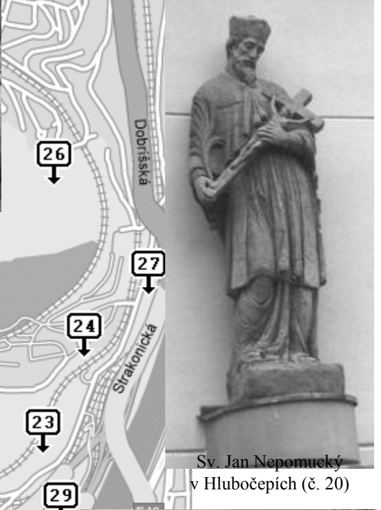
Sv. Jan Nepomucký v Hlubočepích (č. 20)