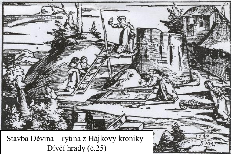
Stavba Děvina – rytina z Hájkovy kroniky Dívčí hrady (č.25)