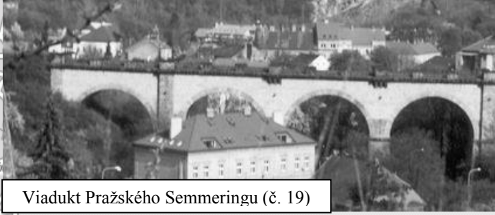
Viadukt Pražského Semmeringu (č. 19)